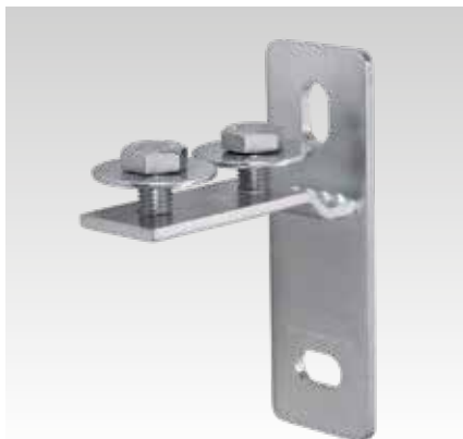
MPC-čelní příruba, příčná