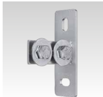
MPC-čelní příruba, podélná