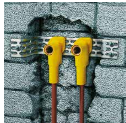
Instalace umyvadla: instalace v úzké drážce