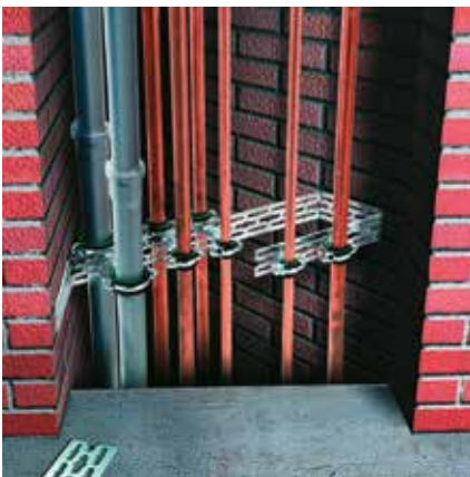
Montáž v šachtě: zásuvná montáž se dvěma objímkami a jednou závitovou tyčí M8 nebo M10 pro upevnění paralelně vedených potrubí