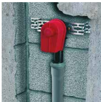
Vestavba do stěny: pračkový sifon