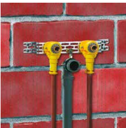
Instalace umyvadla: montáž přesně na rozteče otvorů